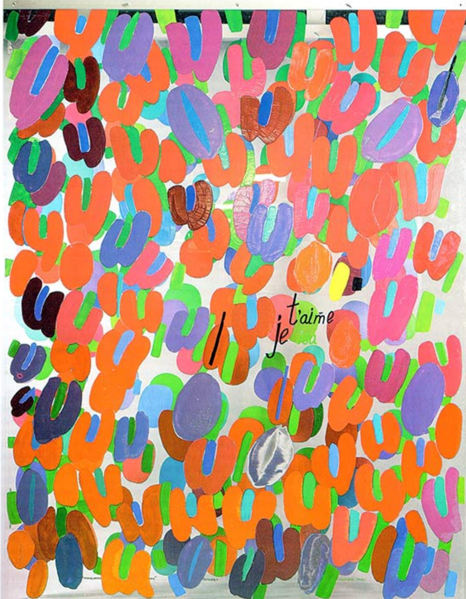
ІВА ПАВЕЛЬЧУК Палітра Червоного, 1994 Целулоїд