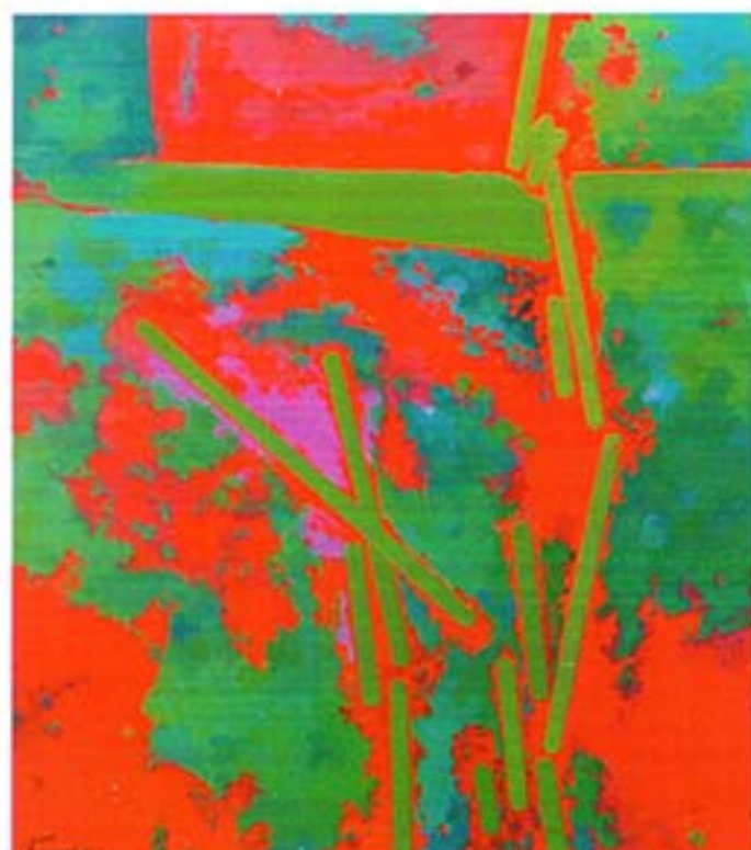
Папроцький Сергій Петрович СВЯТО 2005. Полотно, олія. 90*80