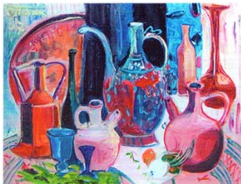
Патик Останн Володимирович ТУРЕЦЬКІ БАНЯКИ 2007. Полотно, олія. 80*100