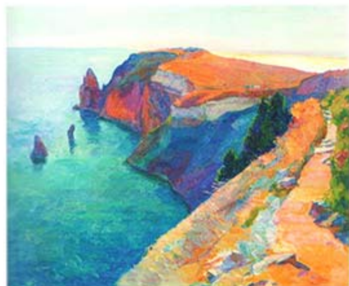
Паїсс Наталя Андріївна ВЕЧІРНІЙ ФІОЛЕНТ 2006. Полотно, олія. 60*70